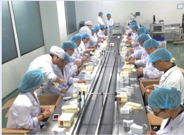
繁忙而有序的志愿者包装现场。