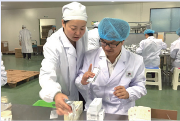
工作人员悉心指导，志愿者用心学习。

为助力胶散丸OU顺利完成订单任务，白药大家庭的志愿者们走出办公室，走进了车间。制造管理党