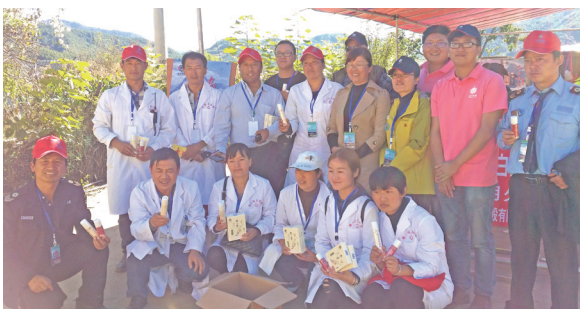
云南白药为活动现场提供产品及医疗服务,助力文化节顺利举办。

除经济建设外,文化品牌打造亦是云南白药对口帮扶重点方向之一。在协助武定白路乡成功打造“火把文化节”的经验基础上,云南白药将继续发力,协助提升攀天阁