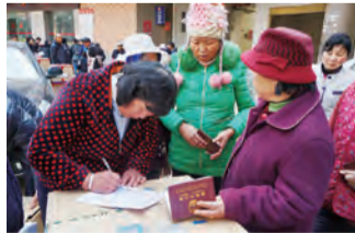
村民凭户口簿按户领取慰问品

份、总价值240多万元的新春慰问品。云南白药表示,是周边社区、单位的共同努力换来了企业的和谐发展。未来的工作中,企业将继续致力于“和谐邻里”共建工作,与“邻居”们一同为干净、平安、美丽的和谐社区建设尽自己的一份努力。(本报)