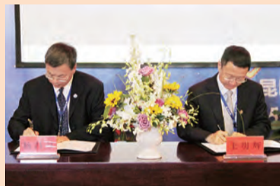
各级领导逐级签订2016年目标任务责任书

会上,公司领导对公司2015年度明星团队及员工、先进基层党组织、优秀共产党员进行了表彰和奖励,各级领导逐级签订了2016年目标任务责任书。(本报)